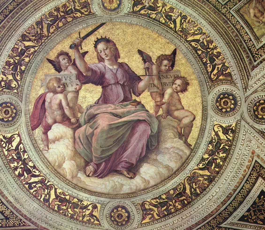
“Justiça” (1508-1511), afresco de Rafael Sanzio

Teto da Stanza della Segnatura, nos Museus do Vaticano