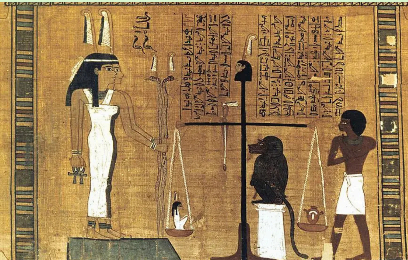
Pesagem do Coração, do Livro dos Mortos do Egito Antigo, cerca de 1.300 a.C.