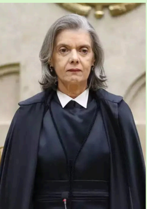
Cármem Lúcia, ministra do STF

Teto da Stanza della Segnatura, nos Museus do Vaticano