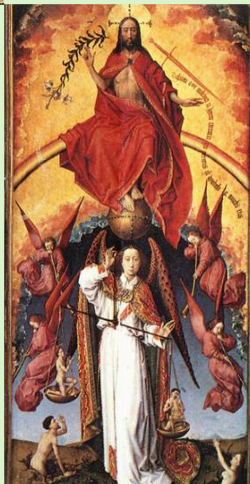
O Retábulo de Beaune (ou O Juízo Final), 1443-1451, de Rogier van der Weyden, Países Baixos