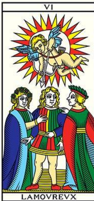
Tarot de Marselha